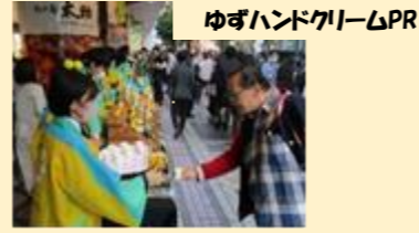
ゆずハンドクリームPR