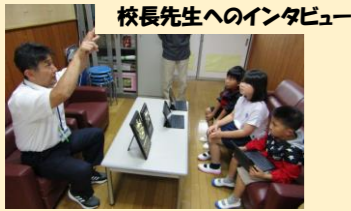
校長先生へのインタビュー