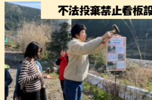
不法投棄禁止看板設置