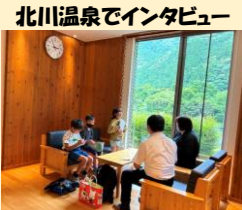
北川温泉でインタビュー