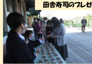
田舎寿司のプレゼント