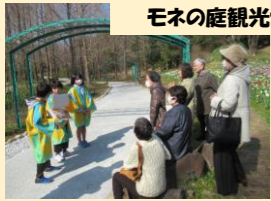
モネの庭観光ガイド