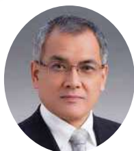
北川村村長 上 村 誠