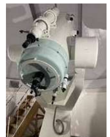
望遠鏡（梶ヶ森天文台）