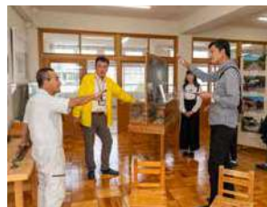
ミュージアムでの解説