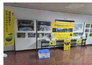
北川村文化祭での展示