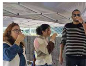
搾りたてを試飲するフランスの 皆さん