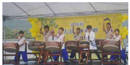
やまなみ太鼓（慎太郎とゆずの郷祭り）

そして11月には長崎県へ旅行しました。今回の旅の目的は、学生時代に私の故郷であるモンタナ州に留学していた友人の結婚祝い！新郎新婦はモンタナ州での留学中に会ったそうで、披露宴にはモンタナ州をテーマにした装飾がたくさんあり、それを見てとてもうれしくなりました。残念ながら私の故郷から出席できた友人はいませんでした。久しぶりに友人に会えたこと、友人の家族や関係者に会えることができてうれしかったです。いつか高知を訪れる計画もあるそうなので、その時は必ず北川村の素晴らしさを案内したいと思っています。