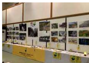
安田町文化祭での展示

それぞれの町村に所在する構成文化財の最近の写真、構成文化財やその周辺地域の昔の写真など、日本遺産ゆずとりんてつを感じられる写真を選びました。会場ではご年配の方からお子さんまで足を止めて写真など眺めていただいている姿を見ることができました。