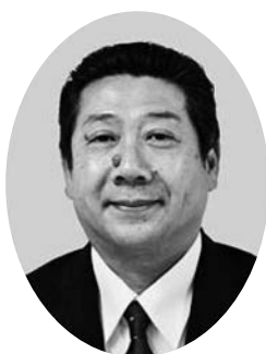
尾崎 一馬 議員