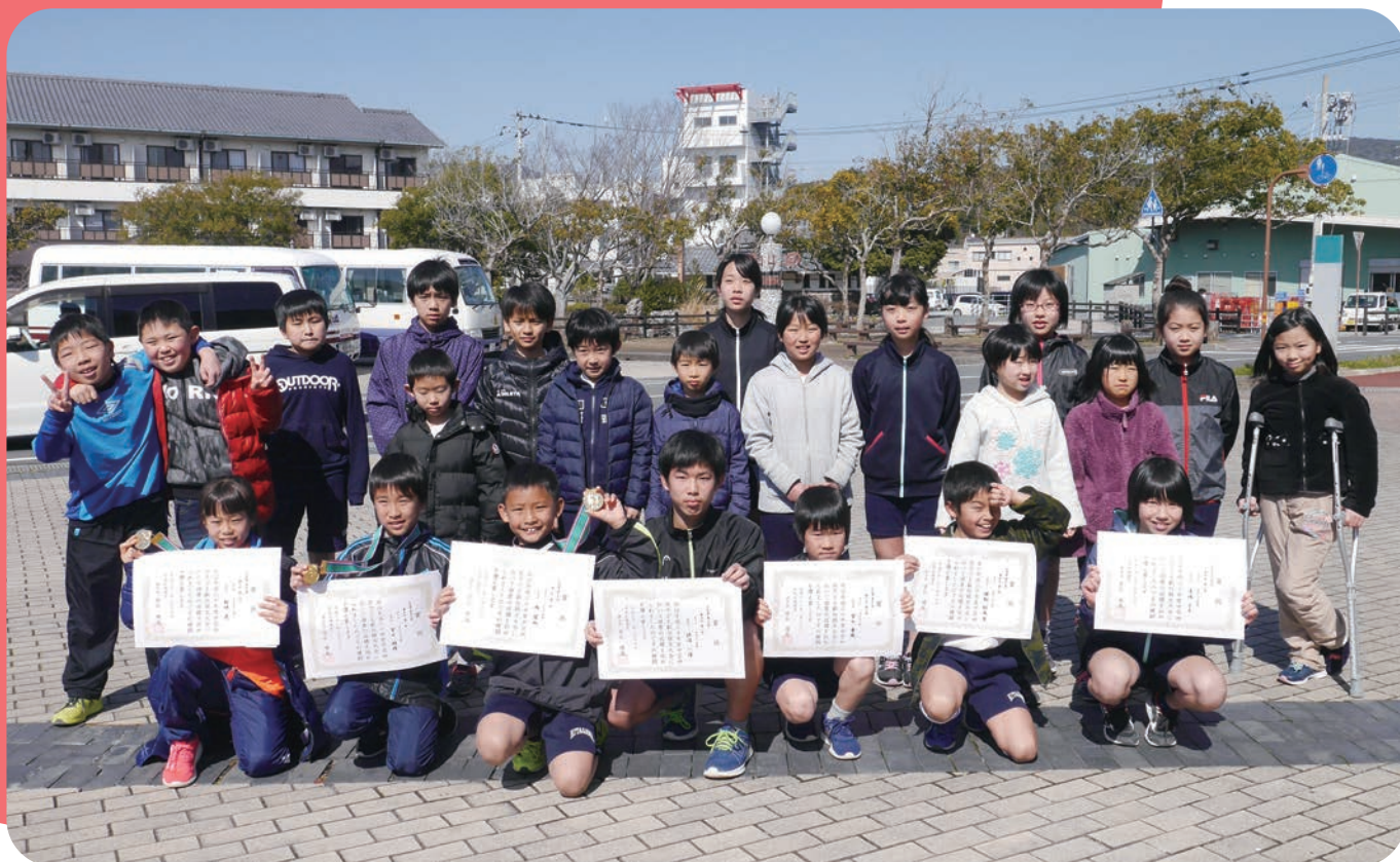
2月17日(日) 中芸地区子ども駅伝競走大会