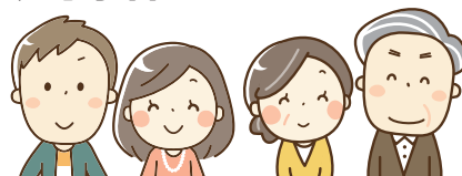
20～74歳の国民健康保険加入者