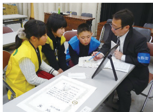
▲表彰式後のインタビューで「4年生全員で取れた賞です。」と答える児童